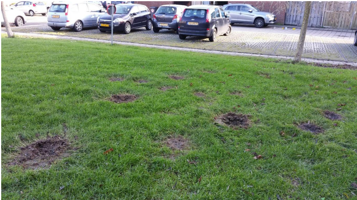
De Beekmos, 1 januari 2018 (ingezonden foto). De modder van het plantsoen zat tot negen meter hoogte op de huizen aan de Beekmos.